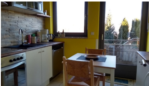
Küche Tisch, Stühle, Kühlschrank, Geschirrspülmaschine, Dunstabzug, Backofen mit Ceranfeld, Mikrowelle, Kaffeemaschine, Toaster, Mixer, Wasserkocher, Geschirr, Besteck, Töpfe und Pfannen, Gläser