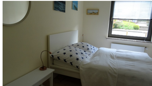
Schlafzimmer Doppelbett (140 x 200), Kleiderschrank, Ablagen