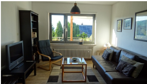
Wohnzimmer Schlafsofa (160 x 200), Sessel, Tisch, Bücherregal, Regal mit Zeitschriften, 2 Schränke, Esstisch mit 4 Stühlen, Kinderhochstuhl, Fernseher (Kabel), Radio