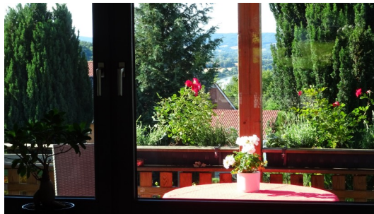
Balkon Markise, Tisch, Stühle