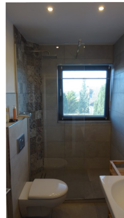
Badezimmer Waschtisch, WC, Dusche, Fön